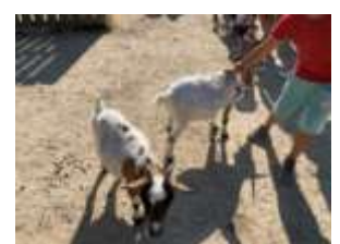
Sortie familles à Branféré - 8 août