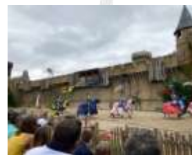
Sortie Puy du Fou - 25 juillet