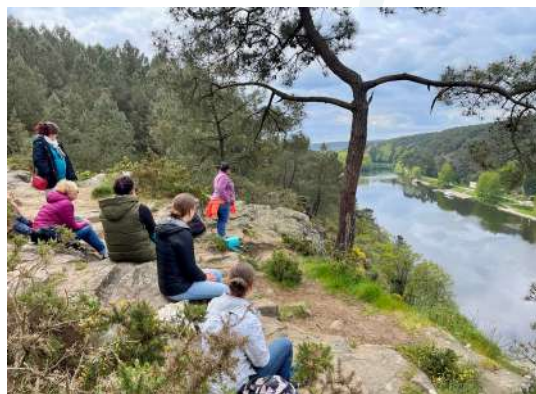
Découverte de la faune avec le CPIE Val de Vilaine